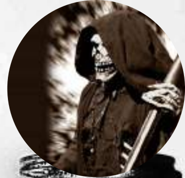
COLABORACIÓN ESPECIAL LA PARCA